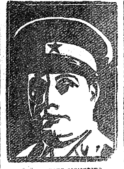
O GAL. GOES MONTEIRO

Rio, (CB) — O general Goes Monteiro, além das declarações já conhecidas, fez mais os seguintes comentários sobre o protesto da Assembleia Legislativa rio-grandense às expressões que usara num desaba-