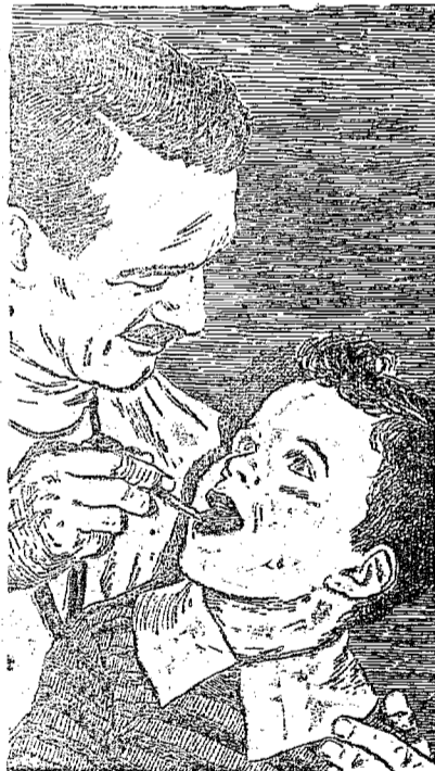
Quando tiver um resfriado forte, vá logo ao médico!

P. O que há de novo no tratamento da pneumonia?