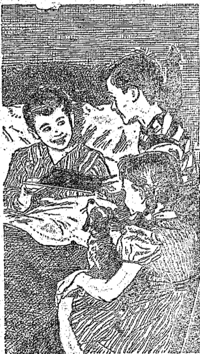
Novos remédios, administrados pelo seu médico, podem salvar 9 de cada 10 doentes de pneumonia!