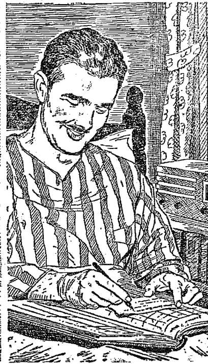
Ajudá-lo nos negócios da família é uma das melhores formas para um inválido ajudar-se a si mesmo.