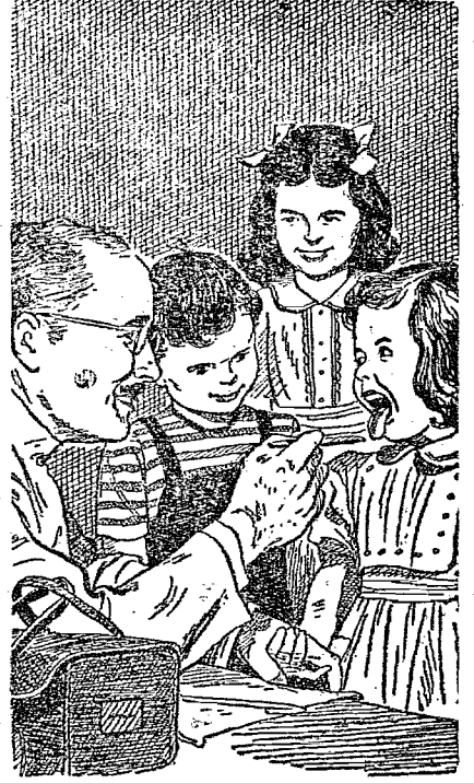
Pequenos distúrbios na infância podem ser os precursores de má saúde. Observe-os!