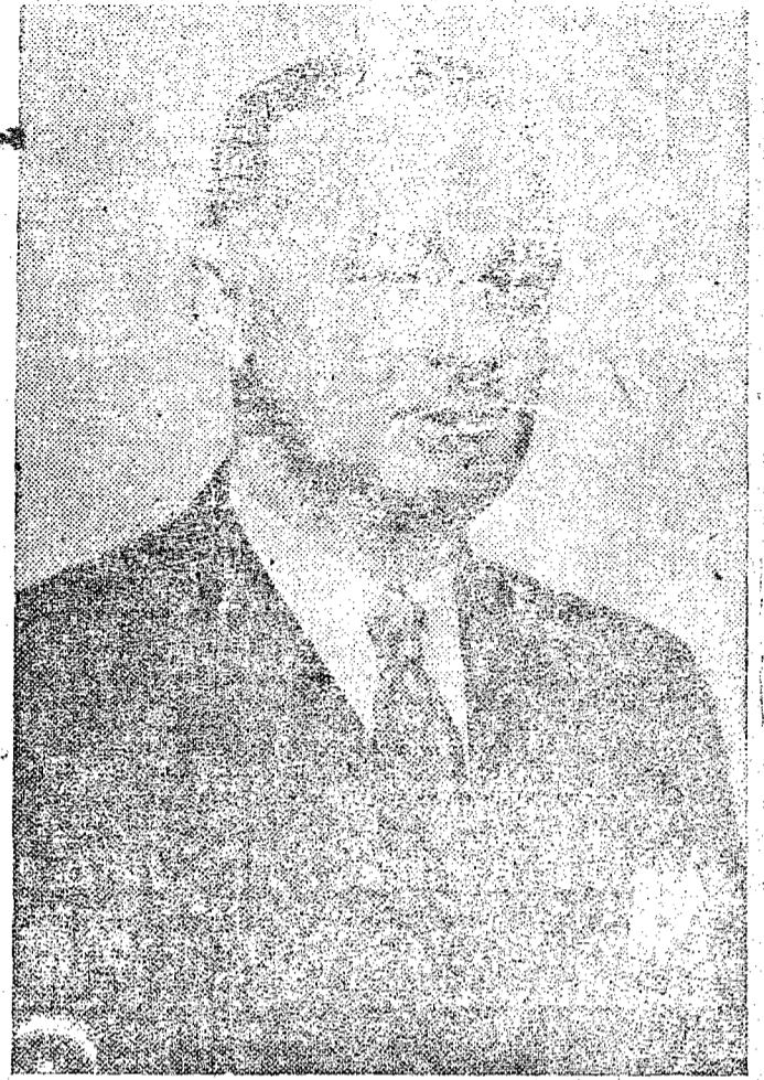
Diretorio Municipal UDN Blumenau