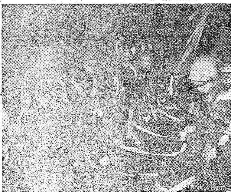
Oito paraquedistas prontos para saltarem sobre a França