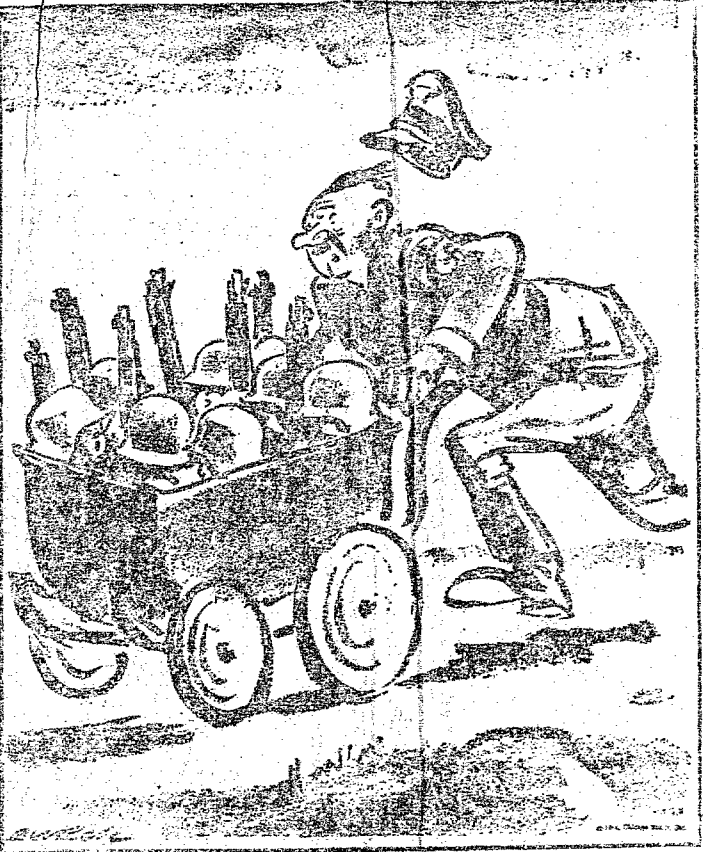
Convocando as Ultimas Reservas.

Felizmente — no seu dizer — expeliu em tempo o veneno ingerido. A policia tomou conhecimento do fato.