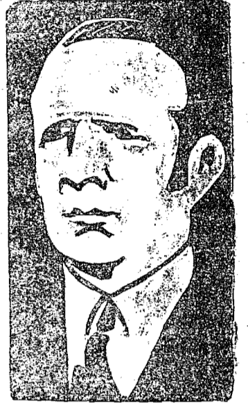
Gal. Flores da Cunha

Rio, 7 — Os jornaes daqui reproduzem uma caricatura inserta no ultimo nr. da "Folha da Noite", de S. Paulo de autoria do conhecido artista do lapis, Belmonte, a qual, sob