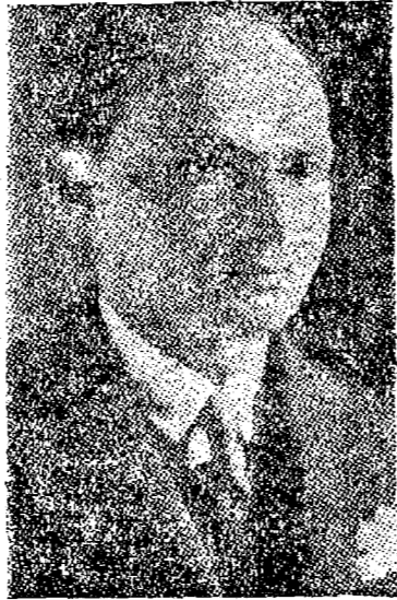
Sr. Agamenon Magalhães

O ministro do Trabalho reuniu todos os gerentes de fabricas do Rio para transmitir-lhes instruccões sobre a propaganda contra o communismo a ser effectuada junto aos operarios. Diariamente e por cinco ou dez minutos, os manufactores carticos, antes de entrar no serviço, ouvirão a palavra simples dos seus chefes, mostrando, numa linguagem humana e acessivel,