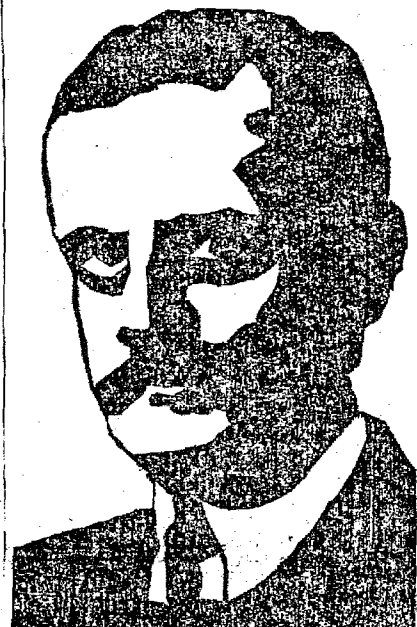
Sr. SANVEDRA LAMAS que suas sessões não serão suspensas enquanto não considerarem chegada a oportunidade de concertar a solução da materia a seu cargo.

BUENOS AYRES — A Conferencia da Paz, sob a presidencia do sr. Sanvedra Lamas reuniu-se deliberando