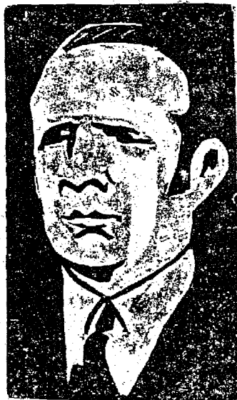
GAL. FLORES DA CUNHA

Rio, 20 — P — Amigos e admiradores do Gal. Flores da Cunha vão lhe prestar uma homenagem, devido aos seus esforços em prol da pa-