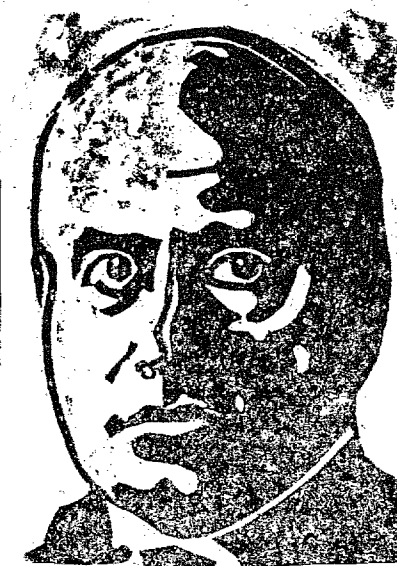
Primeiro Ministro Benito Mussolini

Roma, 16 — Podemos informar seguramente que dentro de breve tempo o sr. Benito