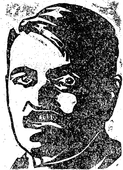
Ministro Pierre Laval

PARIS, 16 — O sr. Pierre Laval, primeiro ministro, convocou varios de seus collegas de ministerio para uma reunião em seu gabinete, em que foi discutido o projecto que será enviado ao Chefe do Governo, visando combater a actual crise financeira