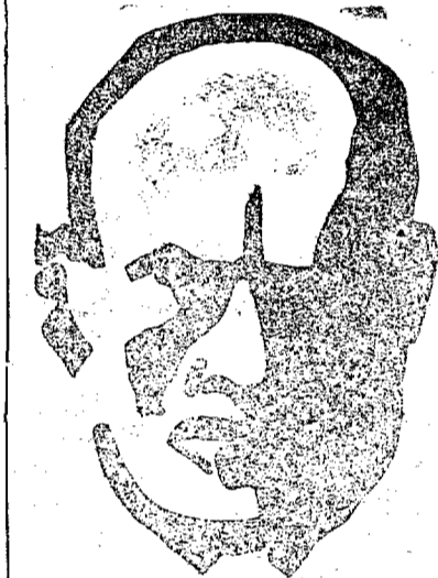
SR. BENITO MUSSOLINI

Roma — O sr. Benito Mussolini escapou milagrosamente de um accidente que por pouco lhe seria fatal, quando realizava um vôo de inspecção, a bordo de um avião militar. O aparelho no qual viajava o chefe do governo italiano foi atingido por um raio em pleno vôo. O radio telegraphista de bordo que foi o mais atingido pelo raio ficou desacordado. Allora isso nada mais soffreu, nem o sr. Mussolini nem os seus companheiros de viagem.