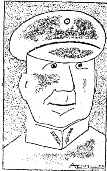
GAL. MANOEL RABELLO, QUE BATEU-SE CONTRA O REAJUSTAMENTO DOS MILITARES

Logo depois dessa arenga os granadeiros romperam os cordões de isolamento e bloquearam algum tempo o carro official, aclamando calorosamente o sr. Mussolini.