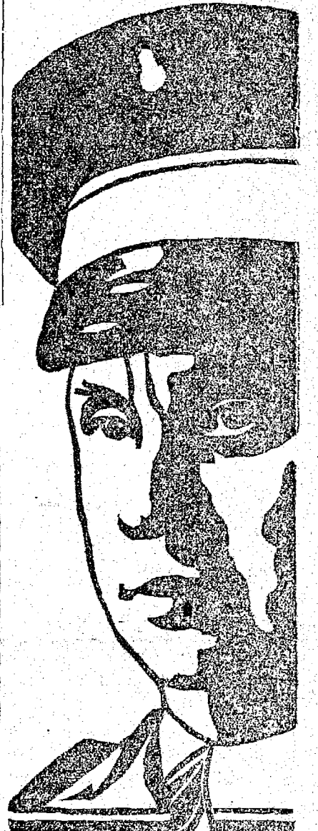
GAL. GÓES MONTEIRO

Rio, 7 (P) — O General Góes Monteiro, Ministro da Guerra, pediu demissão, obtendo-a, do alto cargo que ocupava.