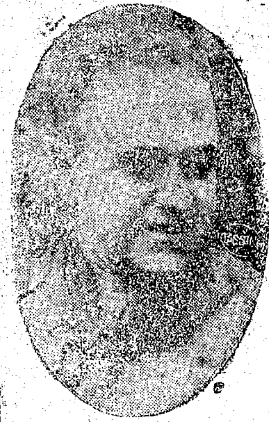
Sr. Getúlio Vargas, que prometeu o aumento dos vencimentos militares

dignas de toda a atenção: a) necessidade do reajustamento geral dos vencimentos civil e militar;