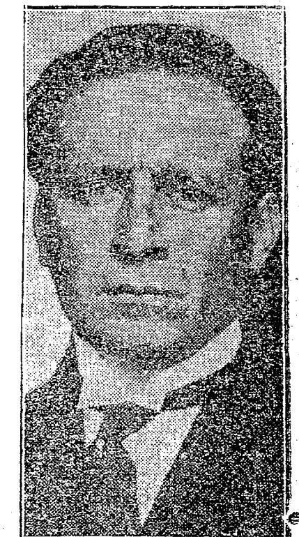
GENERAL FLORES DA CUNHA Flores da Cunha é vivamente aclamado, sendo logo apoz saudado pelo deputado Argemir Dornellas.

Porto Alegre, 16 — Hoje ás 14,30 realizou-se no edificio da Assembléa Constituinte, a solemniaidade da posse do sr. Flores da Cunha. A Brigada Militar prestou-lhe grandiosa homenagem, formando cerca de 2 mil homens. Ao entrar no recinto da Assembléa, o sr.