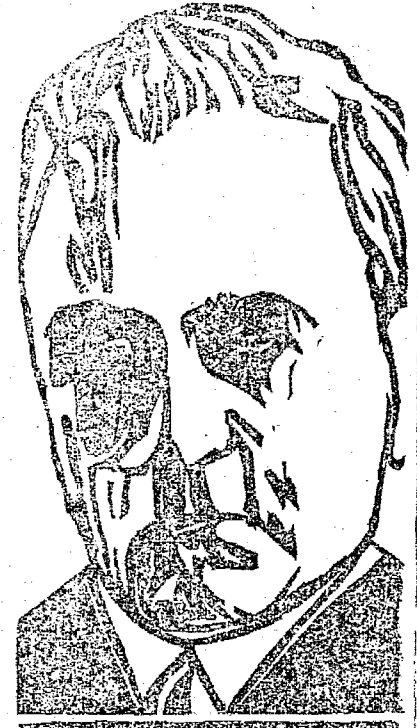
SR. GETULIO VARGAS

Buenos Ayres, 12 — Esta cidade prepara-se para receber festivamente o exmo. dr. Getulio Vargas, presidente do Brasil. Já estão adeanta-