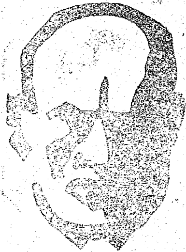
SR. BENITO MUSSOLINI

Roma, 12 — Informações de Paris dizem que o gover-