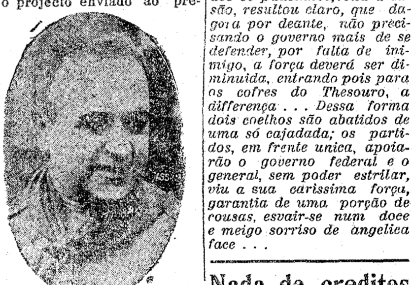
SR. GETULIO VARGAS