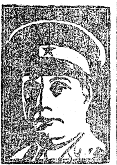
Gal. Góes Monteiro

Rio, 26 — O gal. Góes Monteiro, Ministro da Guerra, dirigiu ás classes armadas do paiz um manifesto que inicia com o seguinte: "Ao Exercito. Ha um com