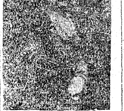
SR. BENITO MUSSOLINI, 1º MINISTRO DA ITALIA

Medidas preventivas na Italia O caso abyssinico em plano secundario Roma, 26 — O governo italiano concentrou tropas na fronteira em virtude da situação inquietante e con-