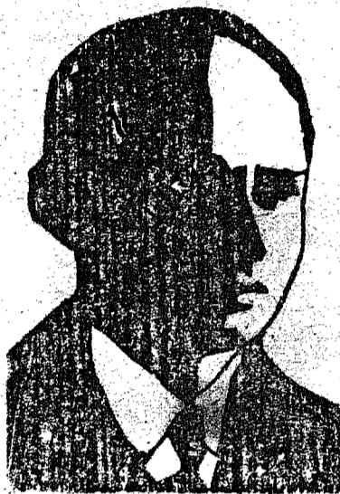
Ministro Agamenon Magalhães