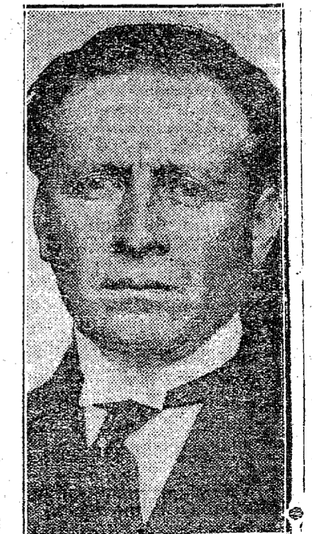
Gal. Flores da Cunha esta capital. O governador gauchão viajará de avião.

RIO, 13 — Noticias de Porto Alegre informam que o gal. Flores da Cunha seguirá amanhã, sabbado, para