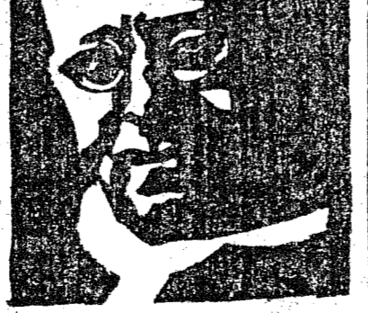
S. S. PIO XI

Asmara, 3 — Os correspondentes dos jornaes estrangeiros informam que a tactica das operações militares ethiopes em Ual Ual é completamente infructifera. Suas tropas são constantemente desbaratadas, deixando no terreno numerosos mortos e feridos. As perdas dos italianos são minimas.