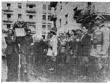
HEROIS DE NAPLES — Entrou de frente jovens italianos antifascistas mortos em ação contra os nazistas nos dias que precederam a ocupação de Naples pelas forças aliadas. Esses jovens ofereceram sua vida em holocausto à sagrada causa da liberdade por que se luta toda a humanidade civilizada.

de uma perfeita cozinheira e de uma garçonete com prática. Agenciamos no HOTEL PAULI.