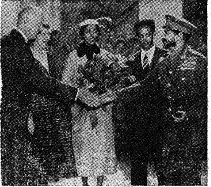
Sua Imperial Majestade Haile Selassie I, imperador da Etiópia, embeirado da família real são cumprimentados nas escadarias da Casa Branca, em Washington, pelo presidente Dwight D. Eisenhower. O imperador etíope e sua comitiva oficial visitaram os Estados Unidos a convite do presidente Eisenhower.