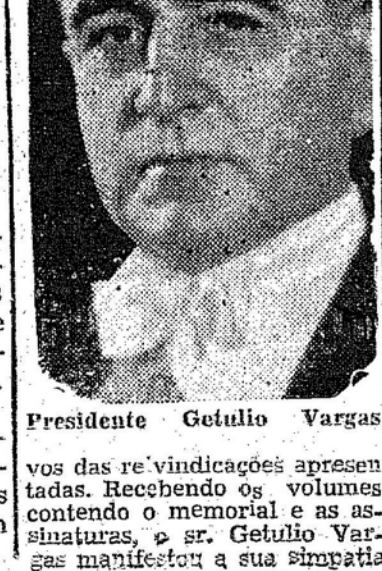
Presidente Getulio Vargas