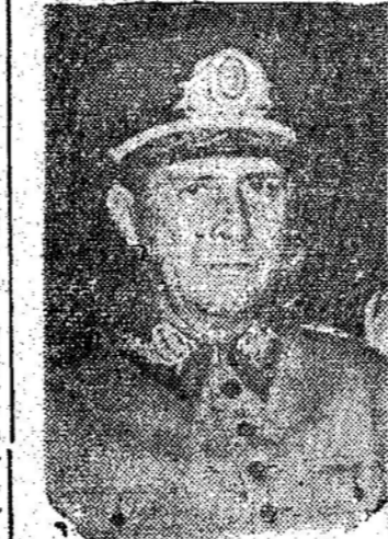
General Canrobert RIO, 26 (Merid.) — Tomou posse hoje da presidência do Clube Militar...