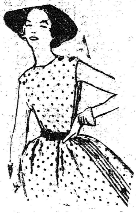
O vestido branco estampado de pastilhas verdes, preso por botões sobre um ombro, tem februns pretos bem finos, com botões ao longo da saia ampla.

samente pentear-se e maquiarse, deveriam seguir um desses cursos. Encontra-se de vez em quando pela rua uma mulher que realmente atrai todos os olhos, e se analisarmos o seu fascínio verificamos que ele é feito, justamente de graça, de caminhar, de atitudes, de cumprimentar e de sorrir. São exemplos que mostram como toda mulher pode adquirir esse fascínio, desde que a isso dedique um pouco do seu tempo e uma constante atenção. Um doce sorriso, um gesto elegante, fazem esquecer o nariz um pouco longo, os dentes não perfeitos e até um ligeiro estrabismo!