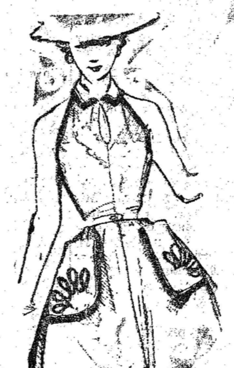
Com um algodão listadinho, faça este modelo ornado de passamanaria verde e vermelha.