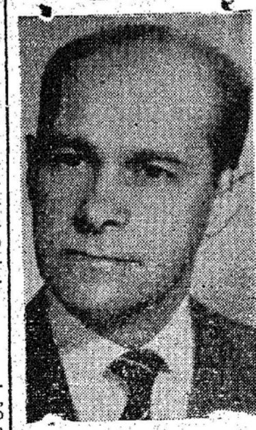
Sr. Tancredo Neves

cançando, segundo alguns, ou realizando importantes gestões políticas junto ao sr.