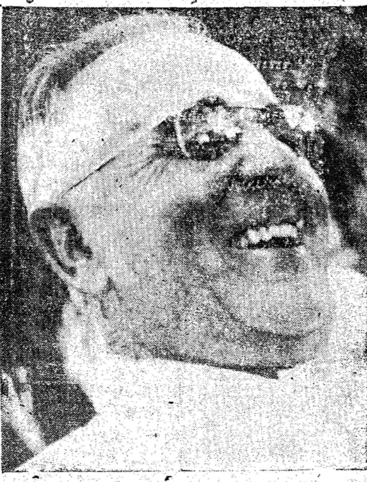
Presidente Getúlio Vargas

RIO (B.J.I.) — Os pinheirais do Sul ainda constituem uma das mais ricas e homogêneas reservas florestais do país e, portanto, uma riqueza que devemos preservar, tão grande é a importância da madeira para as atividades do homem. A mais de duzentos milhões de pés de pinheiros, cabendo a metade desse patrimônio ao Estado de Santa Catarina; assim, nossas disponibilidades de madeira útil dessa espécie podem ser estimadas em um mínimo de 400.400.000 metros cúbicos. Fala-se muito em devastações, mas a verdade é que já existe uma sadia política de restauração dos riquíssimos pinheirais sulinos; o Instituto Nacional do Pinho já tinha plantado, até 1949, mais de 16 milhões de pés, além de 2 milhões plantados por particulares. E' pouco, é mesmo muito pouco, em face do que derrubados, mas já é um princípio de melhor orientação na formação de reservas de matas para o futuro.