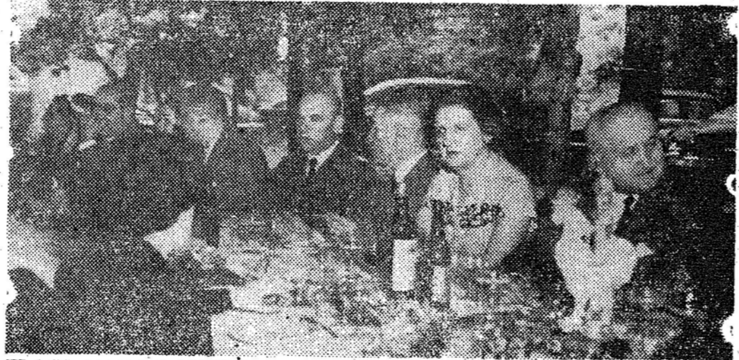
FLAGRANTE DO ALMOÇO — Outro flagrante, colhido na Fazenda do "Galão Branco", durante o almoço.