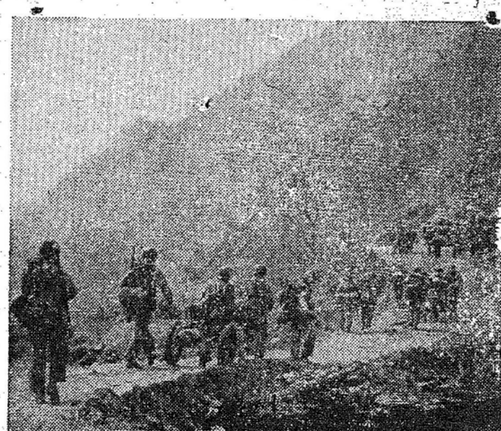
A GUERRA NA COREIA - Fuzileiros navais da Marinha de Guerra dos Estados Unidos...

TINTAS YPIRANGA seu preço por lata parece maior depois de aplicada sai bem menor