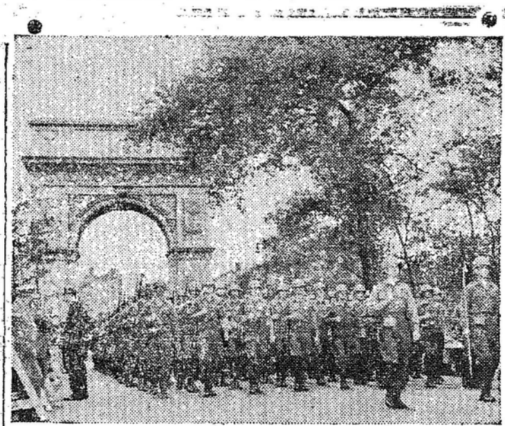
Destilaram recentemente pela cidade de Nova Iorque os soldados componentes do Corpo de Combate do Oitavo Regimento da Quarta Divisão de Infantaria do Exército Norte-Americano...