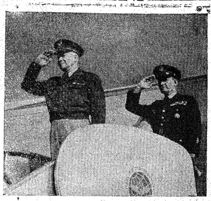
EISENHOWER PARTE PARA A EUROPA - O general Dwight D. Eisenhower (à esquerda), supremo comandante das forças unificadas para a defesa da Europa...