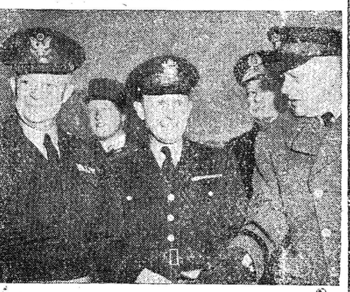
EISENHOWER E PARIS - No decorrer da excursão que realizou pelos países signatários do Pacto do Atlântico Norte...