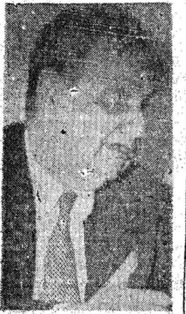
GAL. GOES MONTEIRO

Entretanto, é forçoso que se diga, nem tudo está correndo bem, relativamente ao embelezamento da cidade, mesmo quanto ao mínimo exigido nesse setor e que se acha dentro das possibilidades de realização. Acontece-se, por exemplo, para a situação do jardim existente de frente a Prefeitura, sem dúvida a mais lindo e agradável da cidade. Bem que se poderia repará-lo mais convenientemente para as festas, cuidando-se desde já, da sua limpeza. O Jardim Fritz Mueller, por sua vez, que já se achava em precárias condições, ficou irreconhecível com as obras de calçamento que ali se realizam. Com a terra jogada em cima da grama, esta, segundo todos os cálculos, não despontará mais até setembro, deformando consideravelmente aquele logradouro público, a menos que se queira transformar em canteiros os lugares prejudicados.