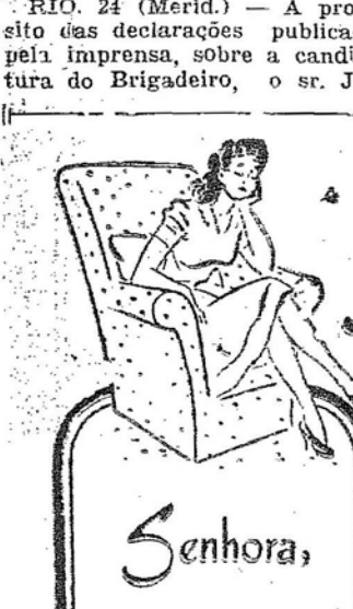
Senhora, não se preocupe, use GYSOFAL, o antisséptico e desodorizante de confiança.