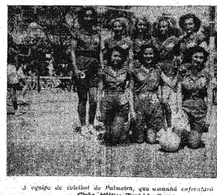
A equipe de voleibol do Palmeira, que amanhã enfrentará a do Clube Atlético-Tupi, de Gaspar.

A preliminar do encontro entre Palmeiras e Duque de Caxias, estará a cargo das equipes femininas de voleibol do Palmeiras, e do Tupi de Gaspar. Ambas as equipes estão preparadas e poderão proporcionar aos amantes do jogo da rede lances sensacionais. Será sem duvida mais uma atração, para a noite de sábado. A equipe gasparense, vem treinando constantemente, e está apta para conseguir um triunfo espetacular. Por sua vez, a equipe feminina do Palmeiras está em grande forma, e tudo fará para conseguir um triunfo dos mais destacados.