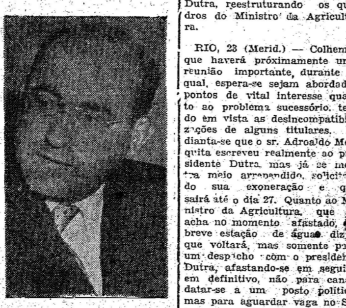
Gov. MOISE'S LUPION

RIO, 23 (Merid.) — Nos meios políticos continua a firme convicção mantida por elementos de responsabilidade, de que haverá demissão coletiva ou a substituição de vários Ministros, até o dia 3 de abril.