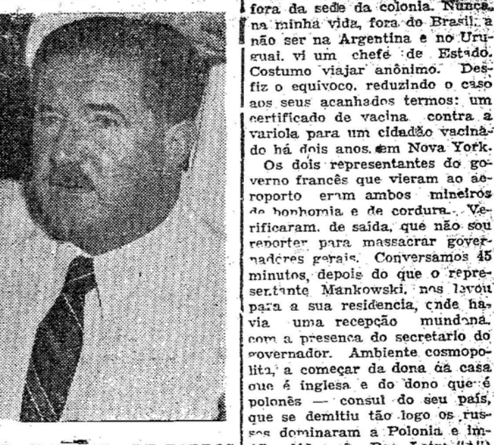
SR. ADHEMAR DE BARROS