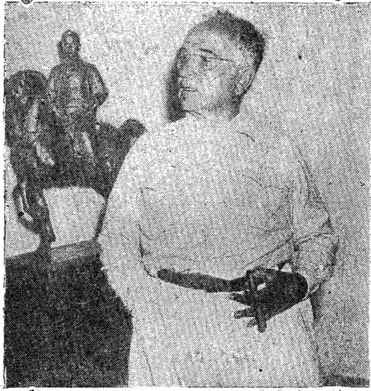
Senador Getulio Vargas

RIO DE JANEIRO, 25 (MERIDIONAL) Sob o título "Meta a Alcançar", publica um jornal desta capital um comentário sobre a situação do mercado do trigo nacional, em face da concorrência do produto estrangeiro.