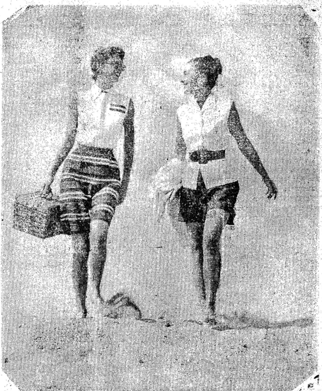
Os trajes elegantes usados nestes modelos reproduzidos na fotografia. À esquerda, "shorts" modernos e véus incluído shorts de tecido de algodão listado, com blusas sem mangas, como os usados com uma blusa de tecido. À direita, a blusa de "pique" usada com os "shorts" da direita, tem uma gola aberta e um largo cinto de couro.

— Está doente meu bem? Posso servir-lhe em alguma coisa? — Sem abrir os olhos Irene soube que era a velha senhora: — Não me importuna — gemeu — estou com uma dor de cabeça que só vai embora quando ninguém me amola. — E' muito desagradável. — Foi a resposta da velha senhora. — Eu tive uma dor de cabeça assim, uma vez. Parece que apareceu quando meu pai me disse que eu só me casaria com Trávia quando ele tivesse 800 dólares. Irene suspirou profundamente. — E a senhora se carou com Trávia e ficou livre da dor de cabeça? — A velha senhora sorriu. Acomodou o tricô no colo e, voltando-se para trás, apontou para um grupo de homens.