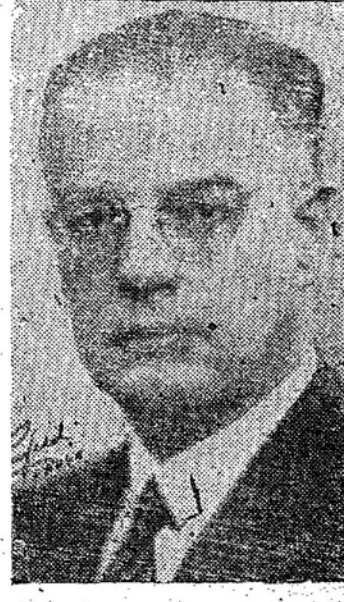
Brig. EDUARDO GOMES