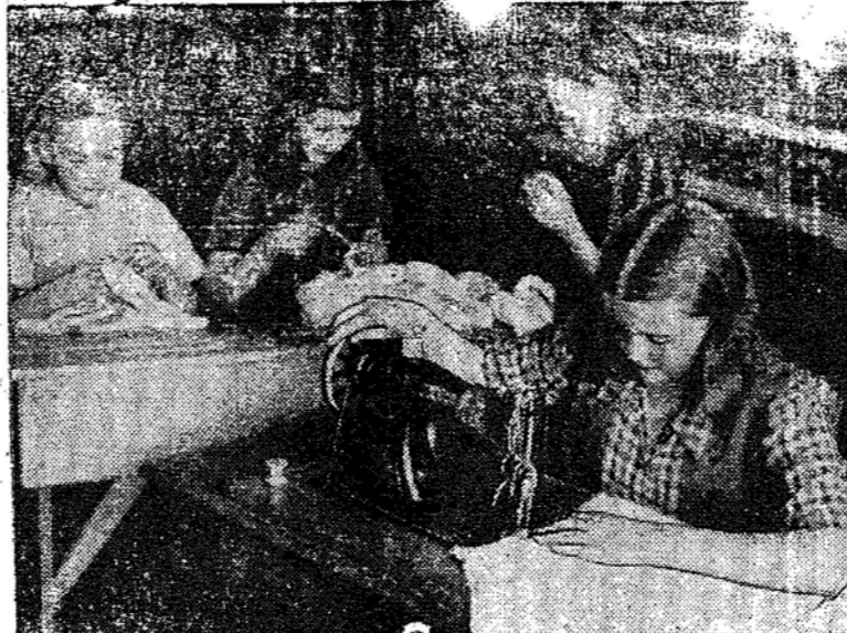
Como parte de uma campanha mundial de auxílio à infância, o Fundo Internacional de Socorro à Infância (FISI) proporcionou alimentação suplementar, sapatos e vestidos às crianças filandras. No flagrante, meninas escolares costumam vestir os para as crianças de seu país com a ajuda da FISI. No Brasil, as atividades do FISI são concentradas principalmente nos Estados do nordeste, onde está sendo organizado um programa intenso de alimentação suplementar e cuidados médicos às crianças e mães.