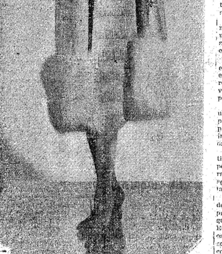
PIERRE BALMAIN — Vestido o manteau de tarde em seda pesada cinza-pérola. Franjas de seda ornamentam a saia do vestido enquanto o manteau se destaca pelo movimento de esboço da gola e pelo largo barrado de pele, influenciado da moda de 1925

Frequentemente, vemos mulheres a se queixar que as tinturas não dão o tom desejado e que o cabelo cai muito depressa, não resistindo ao vento, ao sol, às intempéries, enquanto que a tinteira mesma não deve ser acarinhada. Ela possui, com efeito, toda a tiradade