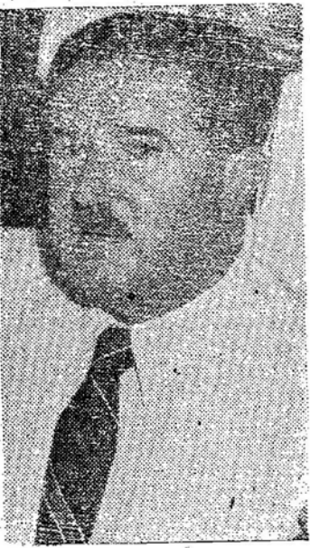
Sr. Adhemar de Barros