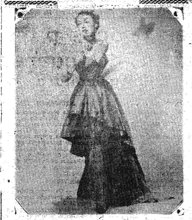
PARIS — Um modelo Alwynn, para a meia-estação, em tarte de cor-de-choocolate, ao qual as saiettes dão especial encanto.