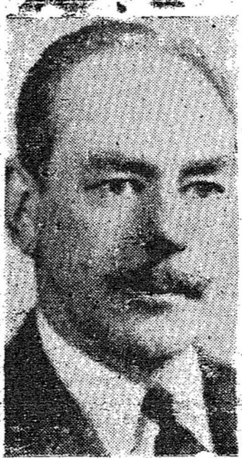
SR. DEAN ACHESON

Procure Getulio subverter a ordem e incendiar o País Constituinte que se negou a assinar a carta magna - Ausentou-se do Congresso para não se comprometer com o regime