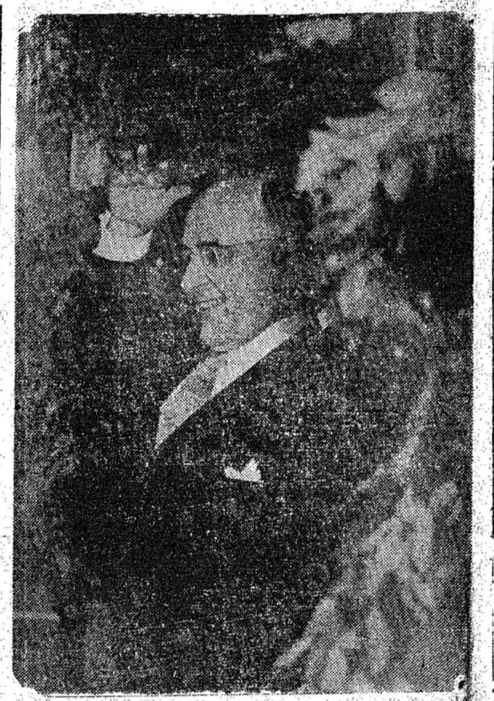
SEJA O ÚLTIMO... DE MAIO DE GETULIO como Dávid, o herói de assíria? É possível que não. Contudo, sempre em sua história. Por certo não imaginaria que aquela seria a última vez que entraria no campo do Vasco da Gama para falar aos homens e mulheres combalidos pelos seus «pelegos». Na 3a. página, o «Anjo da Guarda» conta a preparação desse 1.º de Maio.