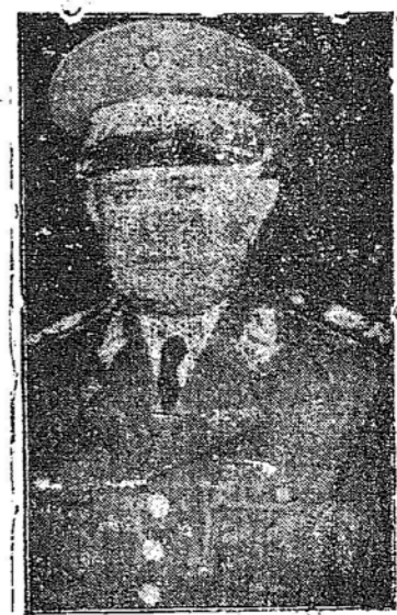
Gen. E. G. Dutra

Art. 2.º - Esta lei entrará em vigor na data de sua publicação, revogadas as disposições em contrário.