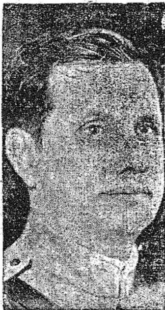
Gal. Goes Monteiro será sensacional. O general Goes Monteiro, da tri-

renunciou a presidência do P. S. D. de Alagoas, "conservando-se, porém, como soldado disciplinado do Partido".