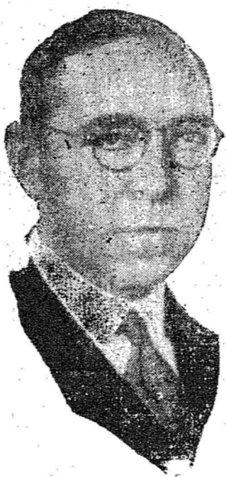
Sen. Nerêu Ramos Rio, 28 (Merid.) - O

Rio, 28 (Meridional) - Deve regressar hoje de Santa Catarina o sr. Nerêu Ramos, que se avisará logo com o presidente Dutra, na qualidade de presidente do PSD, para tratar do caso do telegrama em que a maioria da Câmara Estadual de Alagoas pede um emissário do Governo Federal para tomar conhecimento das denúncias por crimes de responsabilidade do