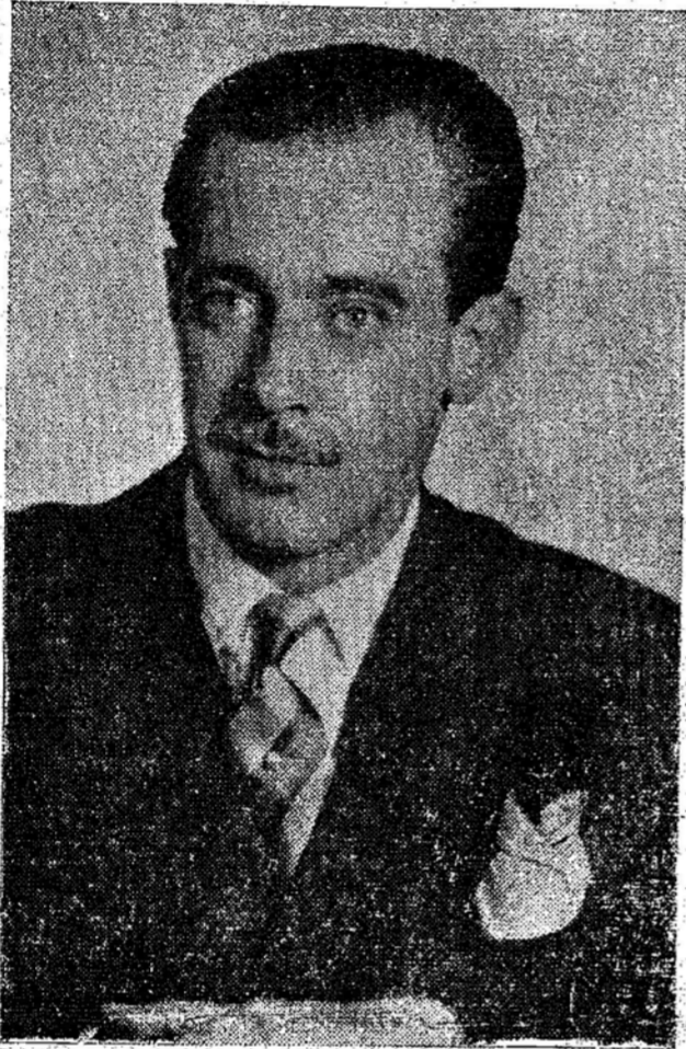
Exonerado das funções do Conselho Administrativo