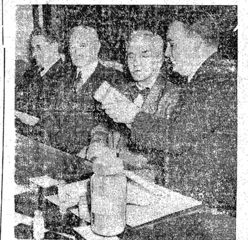
PENICILINA PARA O PUBLICO — O Ministro Britânico do Abastecimento, Sir John Wilmont (à direita) examina, com o descobridor da penicilina, Sir Alexander Fleming, um frasco da já famosa droga, produção de penicilina, realizada no Ministério do Abastecimento.

No regresso tocará em Montevideo e Salvador. Adiantou que o batismo de fogo da corveta deu em 1943, quando da invasão do eu país. A primeira onda de aviões nazistas foi rechaçada pelos navios de guerra, mas a segunda afundou a corveta. Em seguida foi construída nova corveta que recebeu o nome que agora singra o Atlântico Sul. Contou a sua odisséia, pois, tendo sido preso pelos alemães, passou pelos campos de concentração e assistiu cenas pavorosas dos maus tratos e assassinatos em massa de judeus nas câmaras de gás. Citou o caso de um tripulante do seu navio, judeu, que tinha família de 82 membros. Por serem judeus e estarem sob o jugo alemão, foram mortos, sendo ele o único sobrevivente.