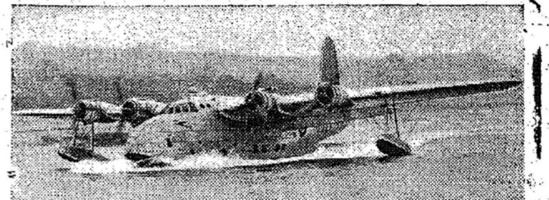
O hidro-avião Sandringham levanta o vôo em Medway.

NOVOS HIDRO AVIOES PARA AS ROTAS DO IMPERIO.