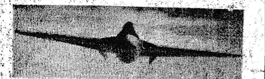
Aqui está o "Vampire", ultimo tipo de caça britânico, a jato propulsão.

Prorrogado o prazo para o recolhimento do mil reis Rio, 25 (Meridional) — A Junta Administrativa da Caixa de Amortização