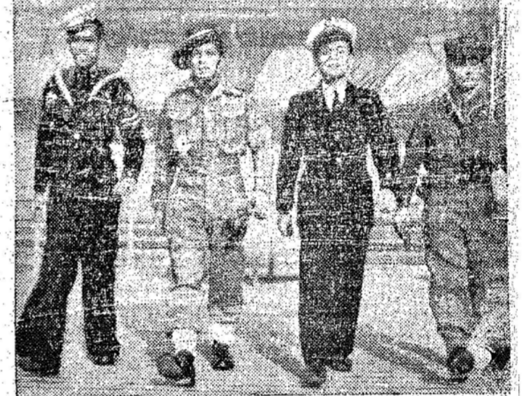
COMBATENTES DO ORIENTE NA PARADA DA VITORIA — Estes quatro representantes das forças armadas do Oriente aliado, marcharam em Londres por ocasião da grande Parada da Vitoria.