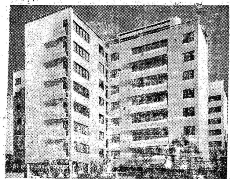
A MODERNA ARQUITETURA NA GRã-BRETANHA: — Um bloco do edifício de apartamentos em Highgate Hill, norte de Londres.

da política de "Bão Vizinho". Visando conhecer um pouco mais de perto o rio Mississippi e o porto, demos uma volta a bordo do "Presidente", num dos grandes vapores especiais, durante 2 horas e meia, — o que nos proporcionou um quadro impressionante desse porto importantíssimo com as suas diversas instalações, e a caas, com inúmeros navios ancorados, além de outros no meio do rio, entre os quais, dois navios do Lloyd Brasileiro, descarregando café. Passamos pelas docas "Porto Rican", docas de "Banana" e outros frutos, para carga em geral, algodão, pelos elevadores de trigo, pelas docas de óleo sal, etc.; avistamos, também, as cidades de Grant e Algiers, os grandes armazéns de marinha americana. As instalações portuárias (caas) tem uma extensão de mais de 16 quilômetros... os armazéns de café, bananas e algodão são os maiores nos EE UU. Apesar dos raios quentes do sol, nossa viagem ao rio (Continua)