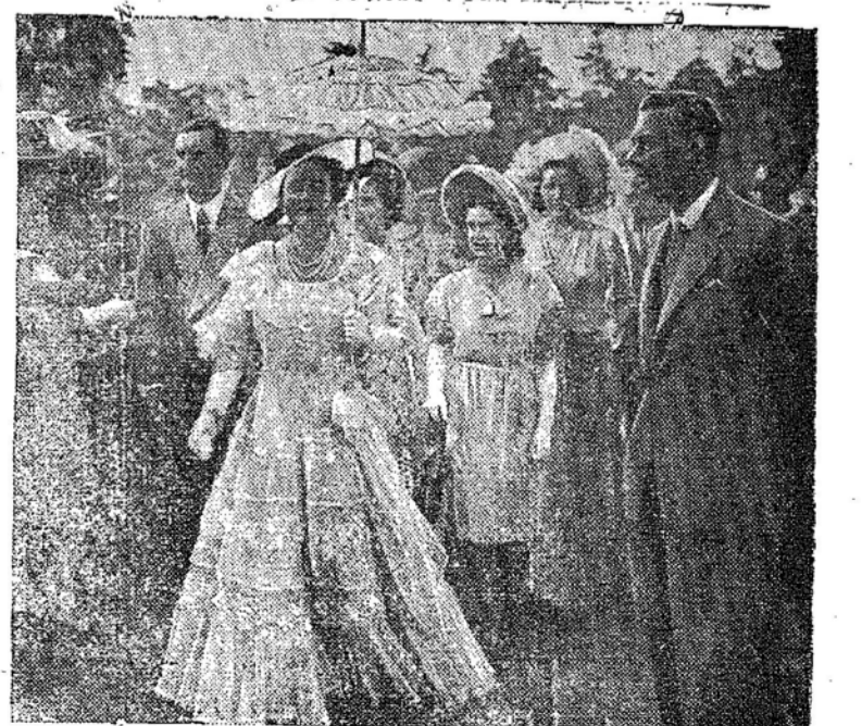
A VIAGEM DA FAMILIA REAL INGLESA A AFRICA DO SUL Suas Magestades e as Princesas passando pelo Victoria Park onde foi dado um "garden party" em sua honra pelo Conselho da Cidade de Port Elizabeth. (BNS)

NÃO TOMOU CONHECIMENTO Niterói, 21 (Merid.) - O T.R.E. do Estado do Rio apreendeu o recurso interposto pelo PSD contra a validade das eleições em Campos. Apenas contra um voto, o TRE decidiu não tomar conhecimento do recurso. COMBATE A MALARIA NO ESTADO DO RIO Niterói, 21 (Merid.) - O governo decretou, abrindo o credito de 10 milhões de cruzeiros para a aquisição do material destinado ao combate á malária no Estado do Rio.