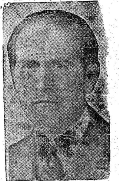
Senhor Osvaldo Aranha desempenhando na assembleia já que é um ato posterior á minha eleição. Não devo minha eleição a nenhum país em particular, muito menos á Russia, mas sim á maioria dos países da O.N.U."