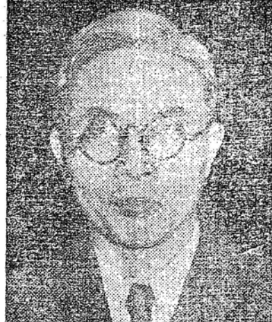
EE. 14 — Dr. Wang Shih-Chieh, Ministro do Exterior da China, chega a Londres para a Conferencia dos Ministros.