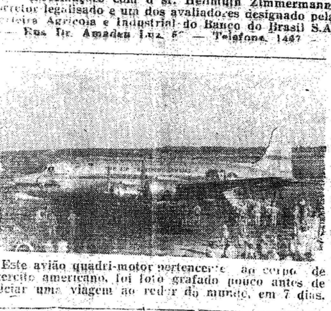
Este avião quadri-motor pertencente ao corpo de aviação americano, foi foto grafado pouco antes de iniciar uma viagem ao redor do mundo, em 7 dias.