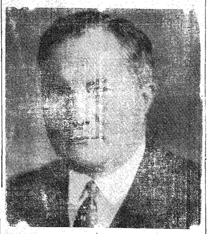
SR. PRULLE BRADEN

Washington 17 (United) — O Secretário de Estado norte-americano, Assistente Spruille Braden, prorrogou a data da Noná Conferencia Internacional dos Estados Americanos, para