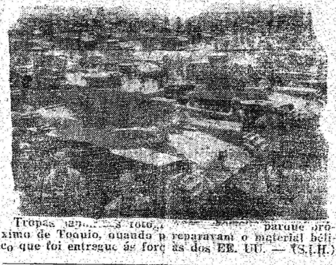
Tropas repararam o material bélico que foi entregue às forças dos EE. UU. — (S.I.H.)

Rio, 17 (Meridional) — Será entregue ao general Mascarenhas de Moraes, durante as comemorações do Dia da Bandeira, no Colegio Militar, grande numero de mensagens glorificando os feitos da Força Expedicionária.