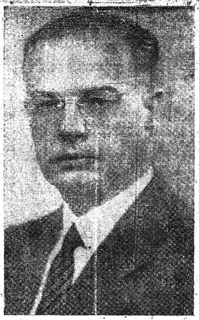
BRIGADEIRO EDUARDO GOMES

O povo de Santa Catarina viverá hoje um dos mais memoráveis dias na sua história política com a visita do Brigadeiro Eduardo Gomes, o candidato democrata Nacional, que falará hoje em Florianópolis no comício promovido pela U. D. N. A visita do candidato nacional ao nosso Estado constituirá mais uma etapa gloriosa na jornada cívica de redemocratização do país.