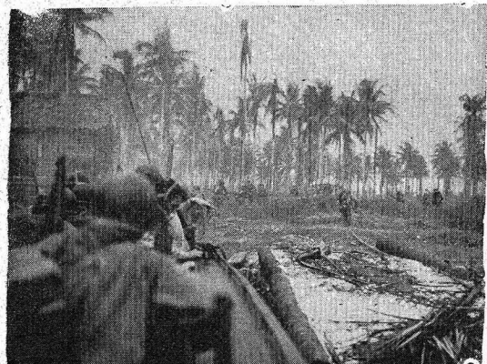
Na gravura vemos soldados norte-americanos examinando os despojos deixados pelo inimigo, após a batalha.