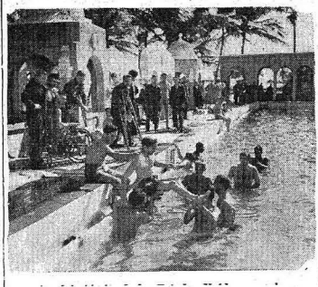
Feridos do exército das Estados Unidos que chegaram ao Brasil em um hospital militar cujo edifício era antes da guerra um luxuoso hotel para turistas, numa cidade do sul do país. (Foto da Inter-Americana).

1. ... que há um conhecido escritor norte-americano chamado Winston Churchill; e que, por causa da ilustreidade de seu nome com o do célebre estadista inglês, não são poucos os cômicos que trocam em que se tem vindo ele envolvido.