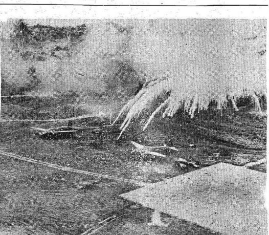
BOMBAS INCENDIARIAS CONTRA OS JAPONÊSES — Na sua campanha para eliminar as forças aéreas do Japão no sudoeste do Pacífico, a aviação aliada lançou grandes quantidades de bombas incendiárias nos ataques contra os aeródromos japoneses. O efeito destruidor dessas bombas pôde ser observado nesta gravura, que nos mostra bombardieiros e caças nipônicos cobertos por uma cortina de fogo durante um ataque contra o aeródromo de Lakunai, em Rabaul.