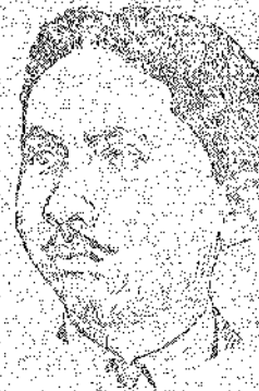
Sr. L. A. de G. Residencia: Pharmancia de Ter- ramburg. Rua de Santa Catharina, 100 Cidade de Florianopolis, Santa Catarina