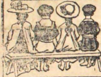
DAUDT & OLIVEIRA - Rio

O melhor remedio para tosse, coqueluche, bronchite, para todas as doenças do peito é o Bromil