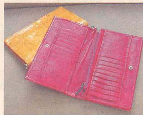
Carteiras - Maria Rita Calçados

O primavera/verão promete fazer muito calor então, arrasem!