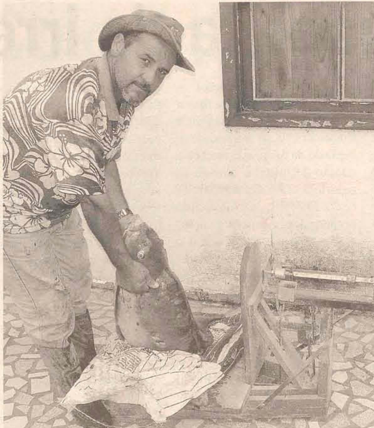
O peixe chama atenção pelo tamanho e peso

O importante e o segredo para sair da pescaria com um troféu como esse é ter paciência e ser persistente, pois pelo exemplo desse pescador foram necessárias quatro horas para voltar feliz para casa.