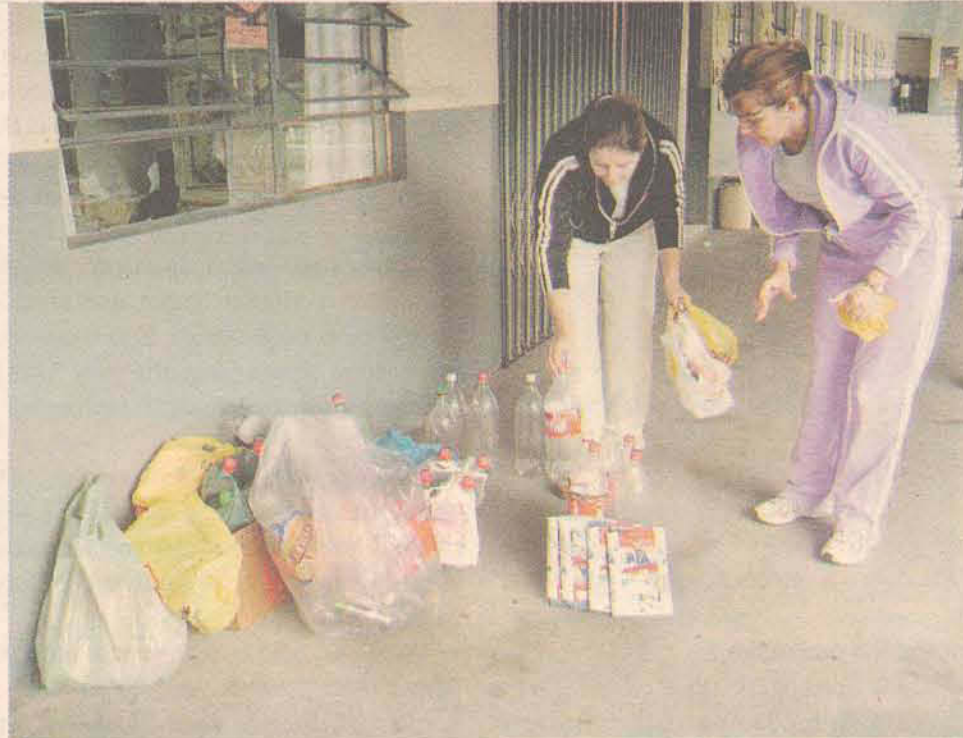
O material foi arrecadado pelos alunos da escola

A inovação faz com que a água saia da caixa d'água e entre nestas células por canos onde é aquecida. A água então retorna para a caixa d'água e sai quente pelas torneiras. Quem desenvolverá o projeto nesta manhã serão os alunos da