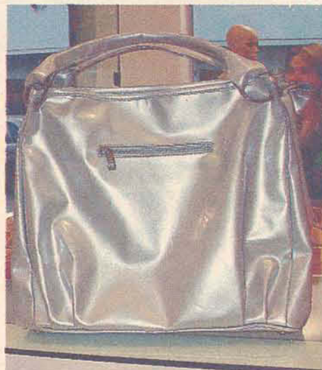
Bolsa - Vizual