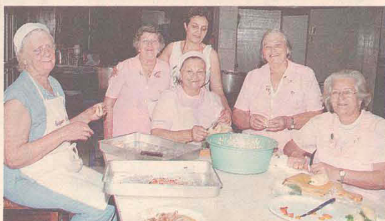
O Lanche Beneficente da Rede no último sábado, teve um toque todo especial pelas próprias voluntárias. Parabéns a estas guerreiras (Rede Feminina de Combate ao Câncer de Gaspar) pelo exemplar trabalho prestado em nossa cidade.