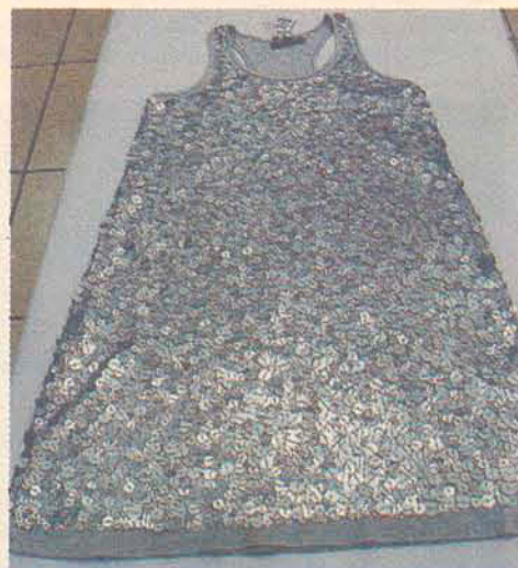
Vestido Paetê - 1/2 Cereja