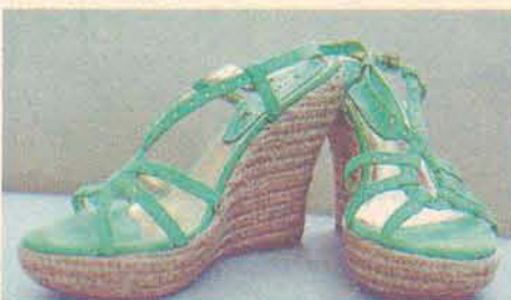
Sandálias - Maria Rita Calçados