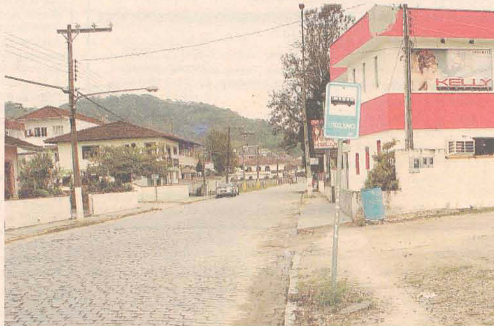
A falta de abrigos de ônibus é uma das reclamações dos moradores.