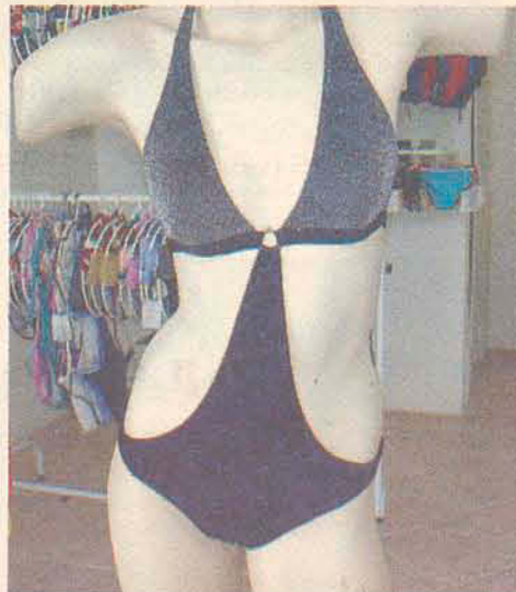
Maiô - Bicho Brasil