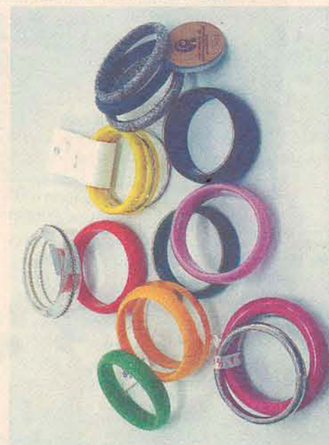
Pulseiras - 1/2 Cereja