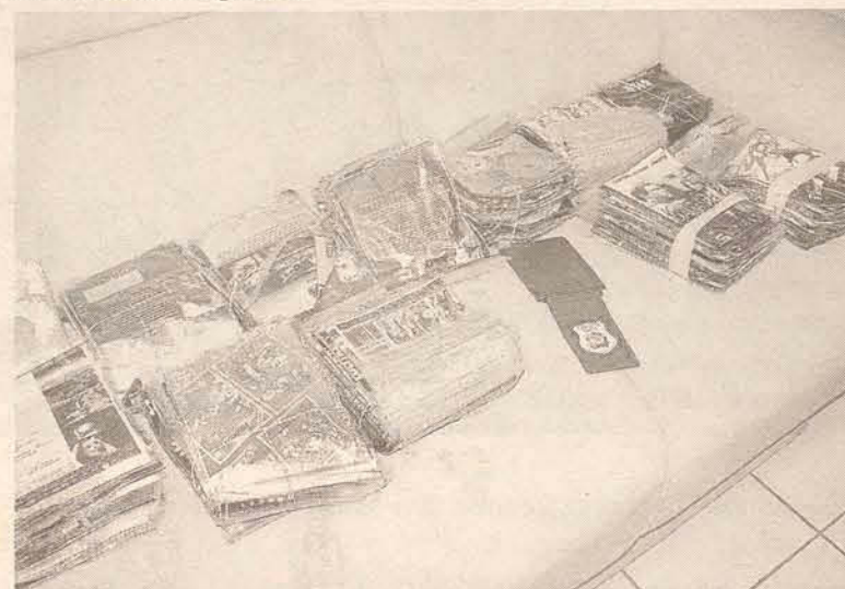
Os DVD's piratas estavam divididos em duas mochilas