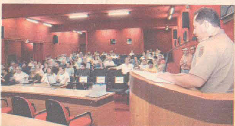
A Polícia Militar foi pouco questionada na audiência

Felizmente no final, após muita discussão, chegaram a um denominador comum e criaram uma comissão para analisar uma maneira de reduzir a burocracia existente.