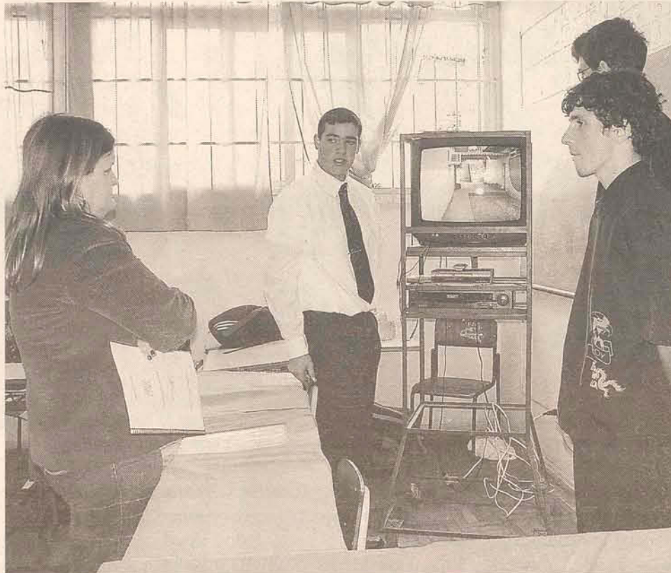
Alunos usaram a criatividade na hora de apresentar os projetos