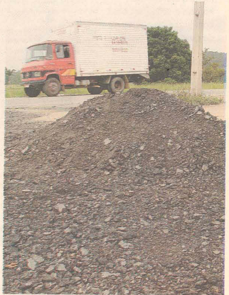
Há diversos locais na cidade com esse material armazenado

E o que está evidente é que esse material está sendo "distribuído" pela empresa que executa a obra na rodovia.