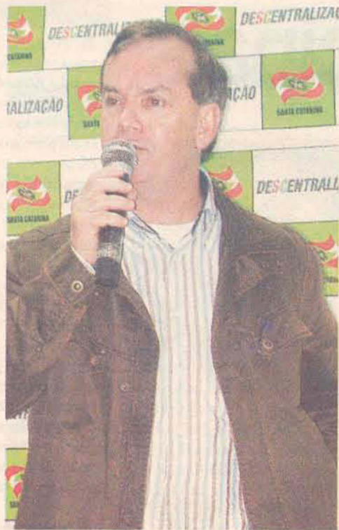
Líderes estaduais são esperados no encontro desse sábado

Na ocasião, será servido um arroz carreteiro doado pelo partido e a expectativa é de um grande público, repetindo a façanha do encontro realizado na Bunge, no qual cerca de 700 pessoas prestigiaram a reunião do