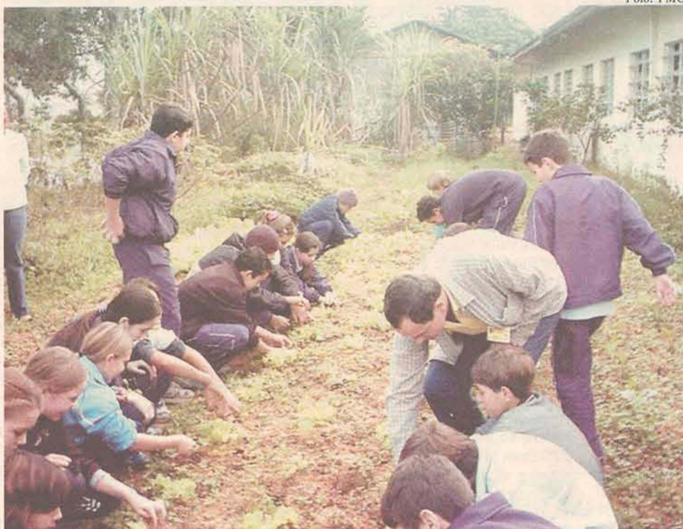
Alunos são os responsáveis pelo manuseio e cultivo das hortas

A reeducação e o estímulo à alimentação saudável através do comprometimento do professor com o ambiente, também são algumas das propostas da parceria. "Esta ação compromete professores, diretores, alunos