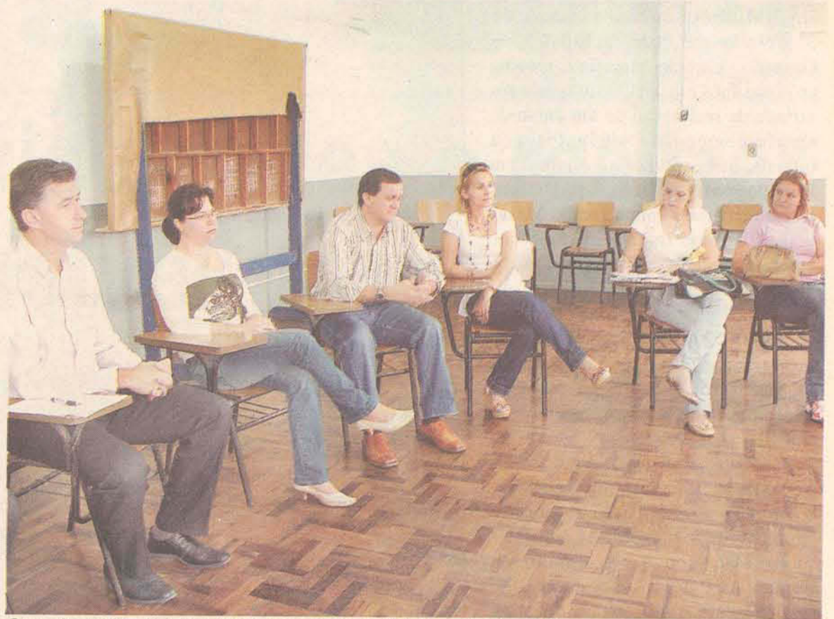
O resultado da campanha foi anunciado na manhã da sexta-feira (14)

27.140 peças foram arrecadadas com a Campanha do Agasalho 2007