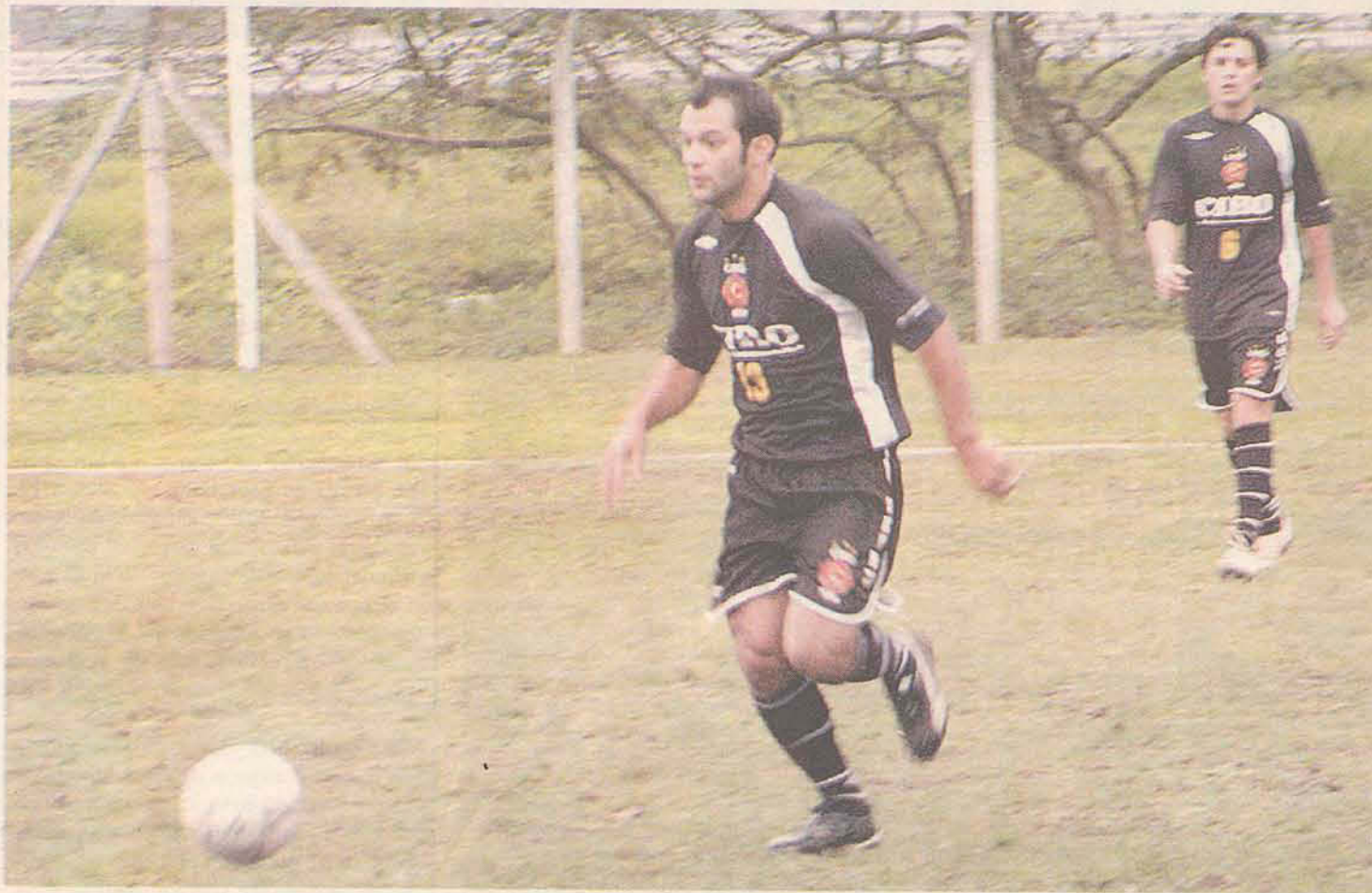
Ciro enfrenta o Sango Malhas valendo uma das vagas para a próxima fase

Este sábado (15) é mais um dia das redes balançarem na última rodada da Taça Lance de Futebol Suíço. A rodada equivale à segunda, que foi adiada por causa do mau tempo e decidirá os 16 times classificados para as oitavas de final. Garantem a classificação os dois primeiros colocados e os quatro melhores terceiros lugares.