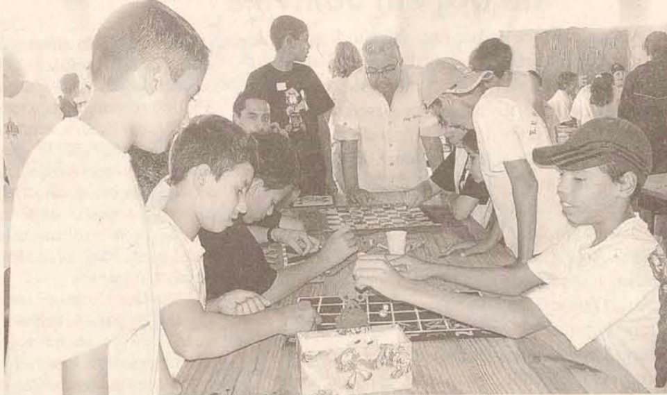
Durante a Mostra, professores interagem com os alunos